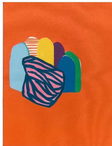
Soo-Kyoung Lee, 2024