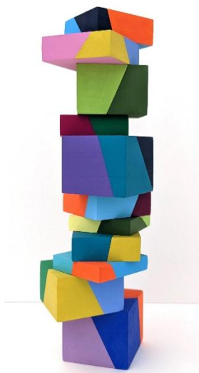
Elodie Boutry, Ototeman (série) 2024